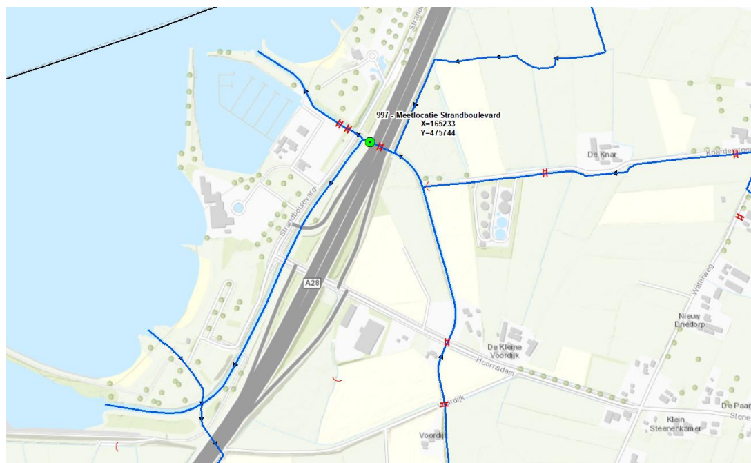
Figuur 1: Overzichtskartaal.