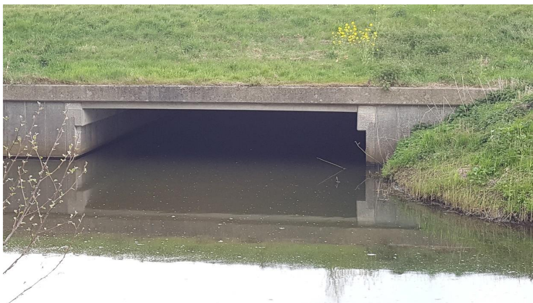
Figuur 3: Foto locatie tijdens veldbezoek op 17 april 2019.