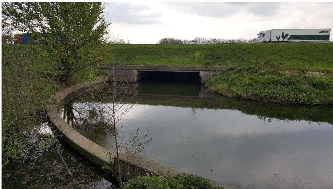
Figuur 2: Foto locatie tijdens veldbezoek op 17 april 2019 (benedenstroomse zijde).